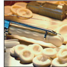
Cubiertas de Endocavidad