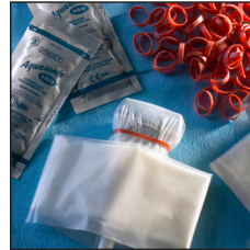
Cubiertas de uso general

-Ridge, C: Sonographers and the Fight Against Nosocomial Infections. J Diag Med Sono 2005; 21:7-11